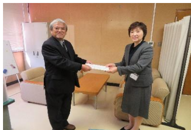
米子市／ (左から) 赤井会長 塚田部長